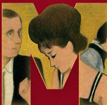
Le notti della luna piena