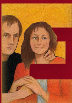
Il raggio verde