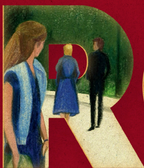
La moglie dell'aviatore