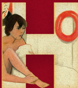
Pauline alla spiaggia