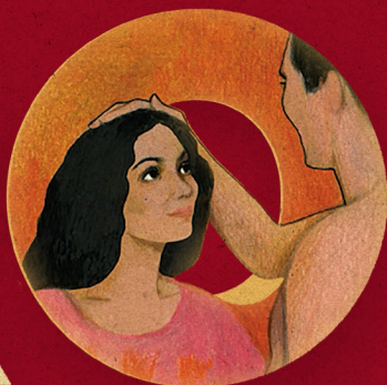
Il bel matrimonio